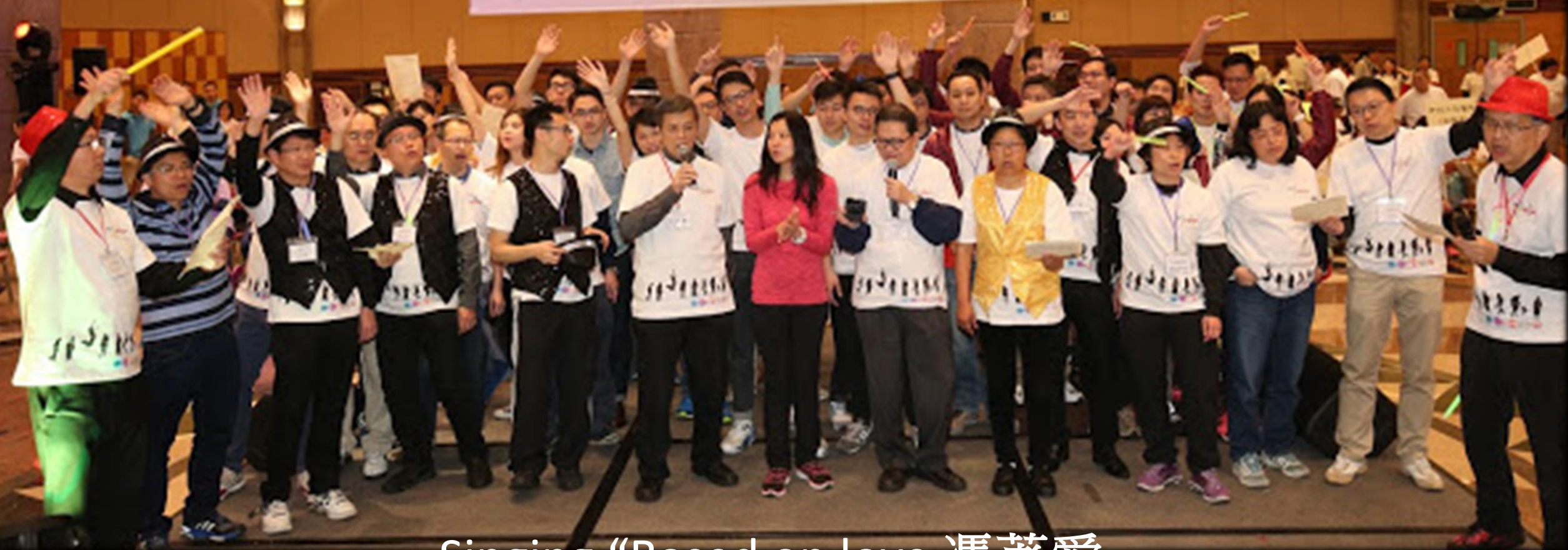
Singing "Based on love 憑著愛"