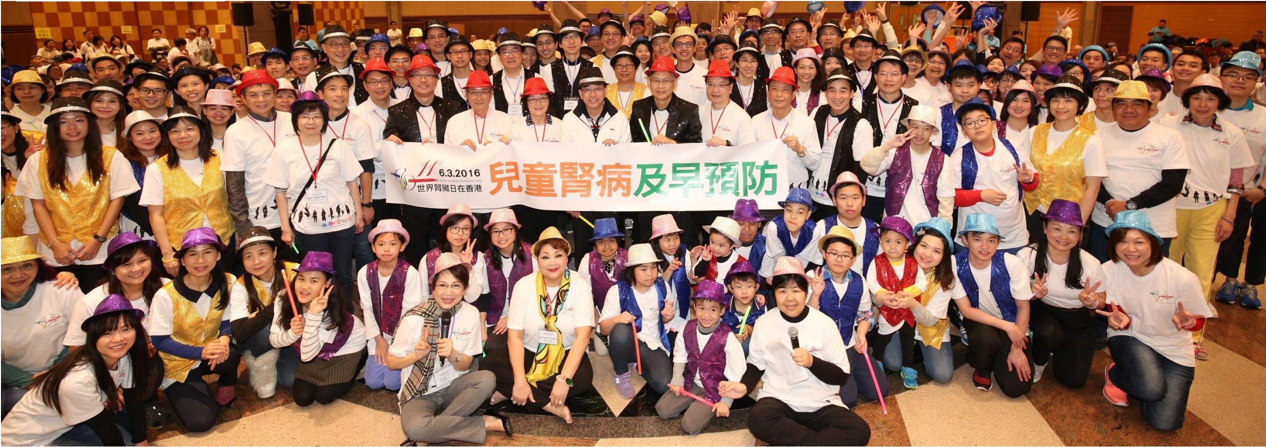
World Kidney Day @ Hong Kong 2016 - Sunday 6 March 2016

International Federation of Kidney Foundations