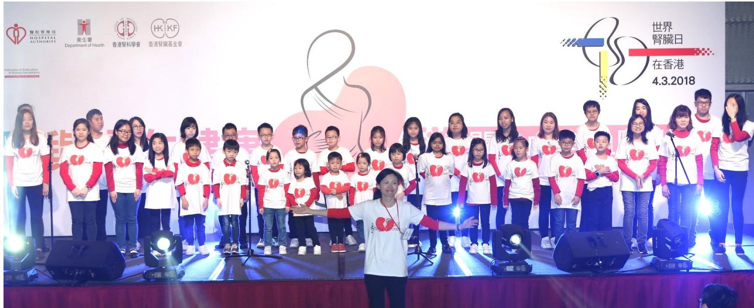
Singing by Children Choir Princess Margaret Hospital (Renal patients)