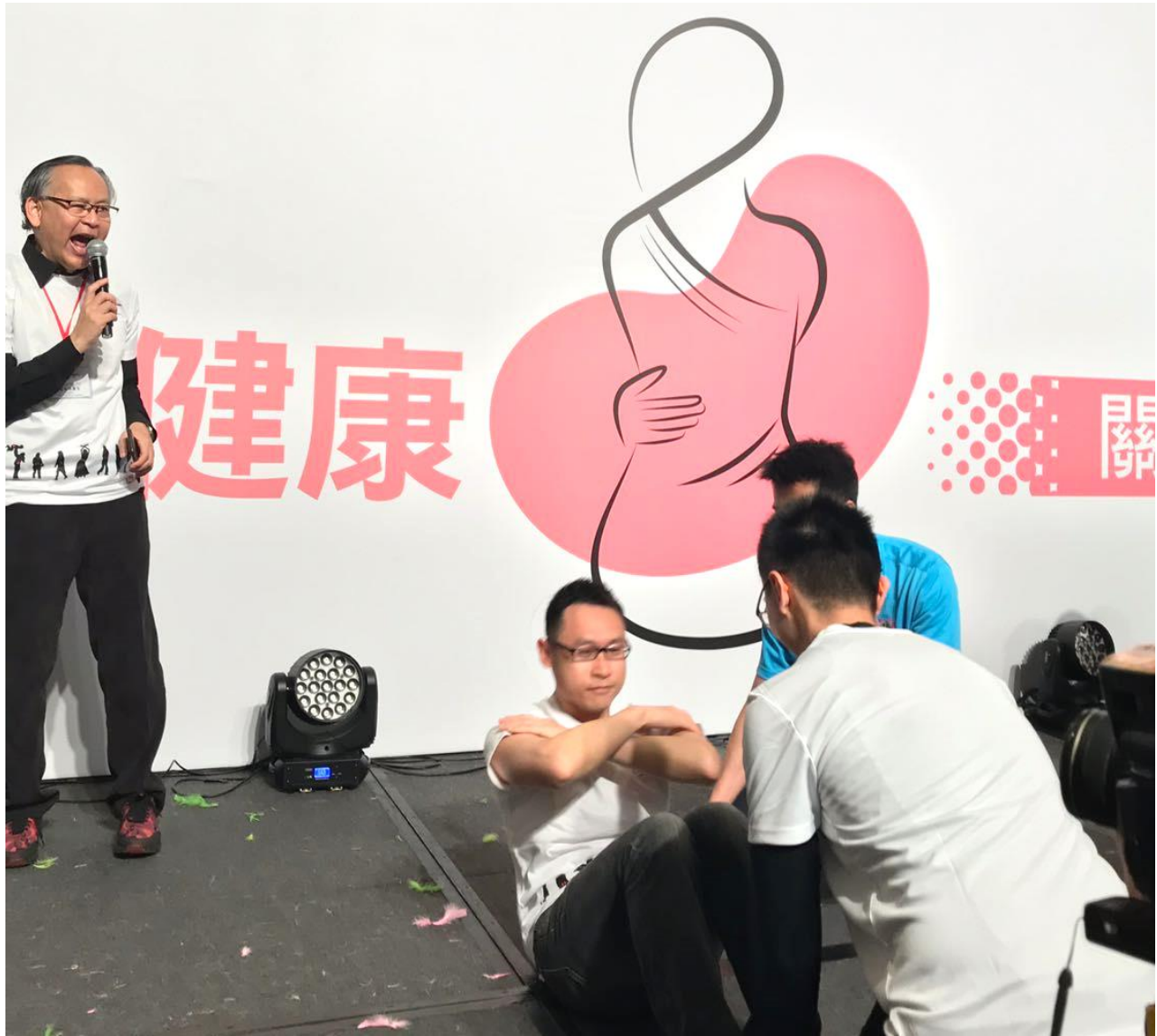
Promotion of Exercise Games