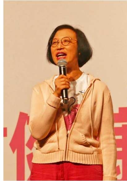
Prof Sophia Chan, JP, Secretary for Food and Health Bureau, HKSAR